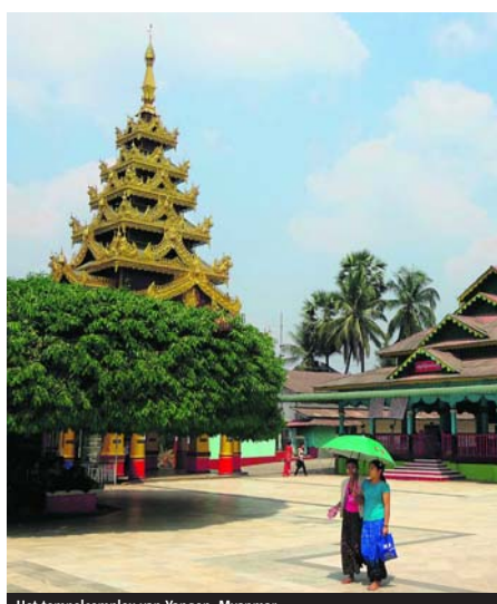
Het tempelcomplex van Yangon, Myanmar.