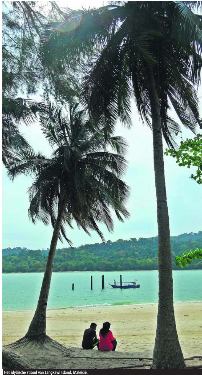
Het idyllische strand van Langkawi Island, Maleisië.

Varen. De wereld zien terwijl je niet één keer je koffer in of uit hoeft te pakken? Onderweg zijn van het ene naar het andere land terwijl je in de bioscoop zit, aan het zonnen bent of een live jazzoptreden bijwoont? Ja, dat kan dus. Het toverwoord is... cruise!