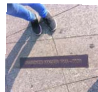
Sheila Ella maakte deze foto in Berlijn, van de plaats waar ooit de Muur stond.